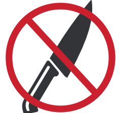
刃物などの 危険物販売

上記禁止事項に限らず、主催者の指示に従っていただけない場合は、営業停止・次回以降の出店を禁止とさせていただきます。