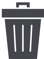
ゴミ・廃棄物の お持ち帰り