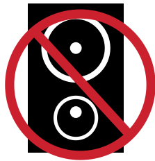
騒音・大声での 客引き