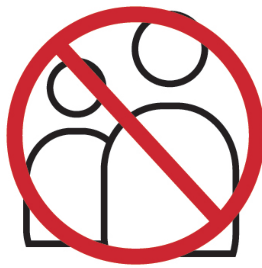
店舗外での 呼び込み