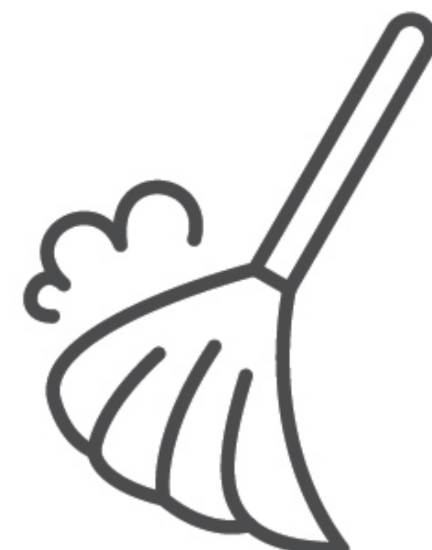
ブース周りの 清掃