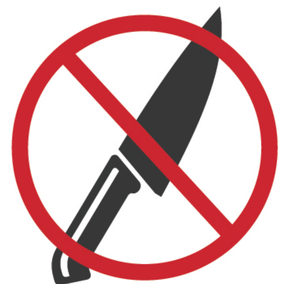
刃物など 危険物販売

上記禁止事項に限らず、主催者の指示に従っていただけない場合は、営業停止・次回以降の出店を禁止とさせていただきます。