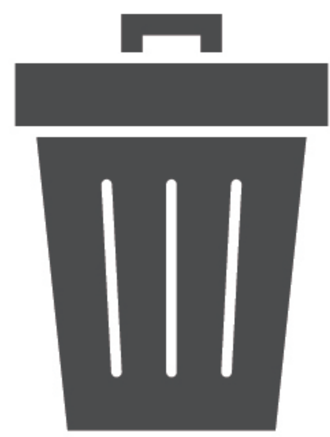
ゴミ・廃棄物の お持ち帰り