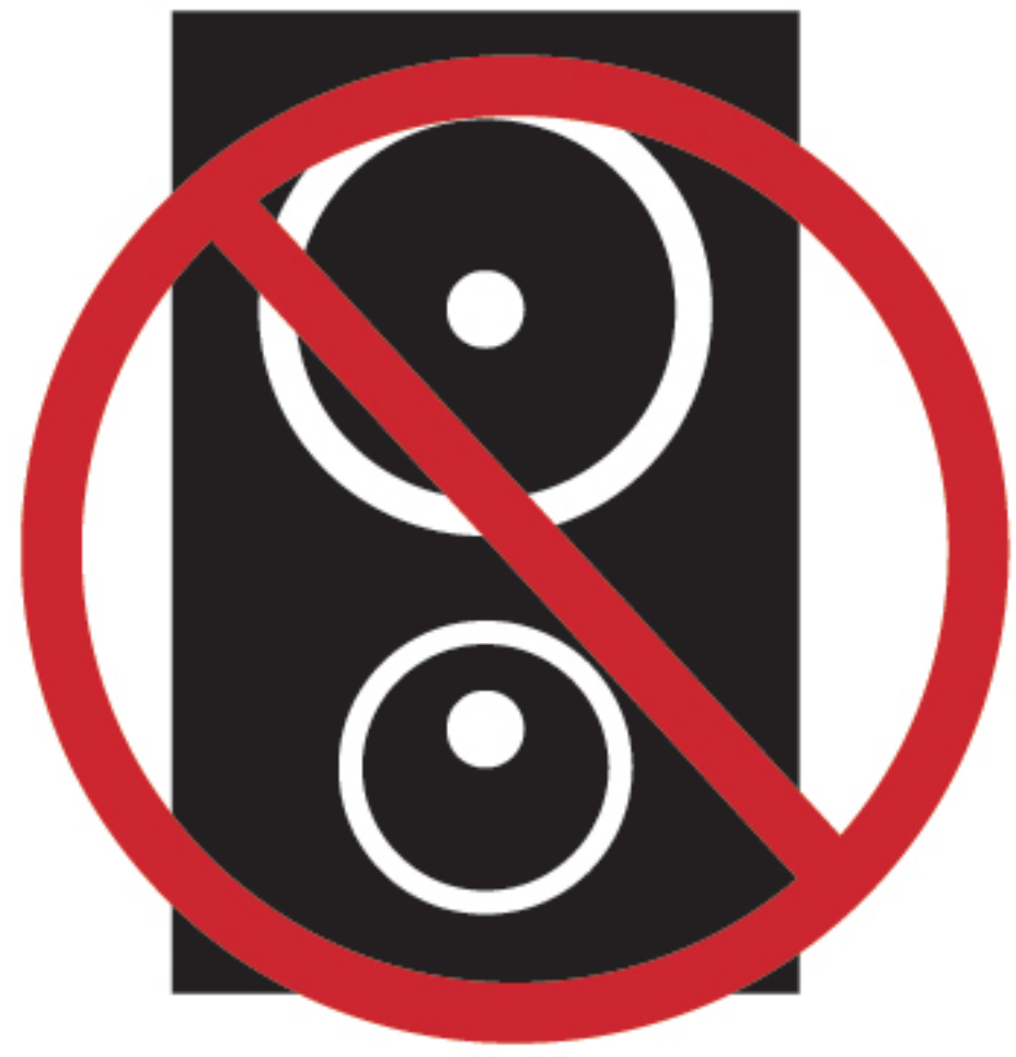
騒音・大声 での客引き