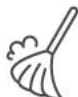
ブース周りの清掃