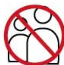
店舗外での呼び込み