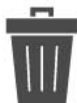
ゴミ・廃棄物のお持ち帰り