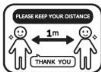
ソーシャルディスタンス