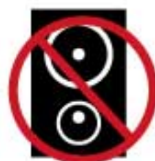
騒音・大声での客引き