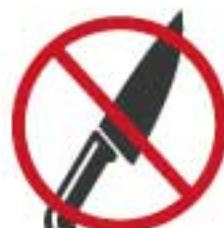
刃物など危険物販売

上記禁止事項に限らず、主催者の指示に従っていただけない場合は、営業停止・次回以降の出店を禁止とさせていただきます。